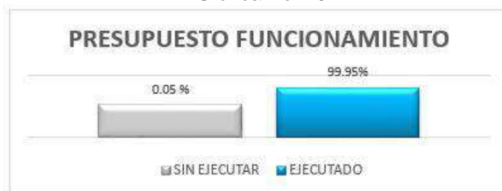
Gráfica No. 10