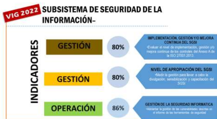
Grafica No 13