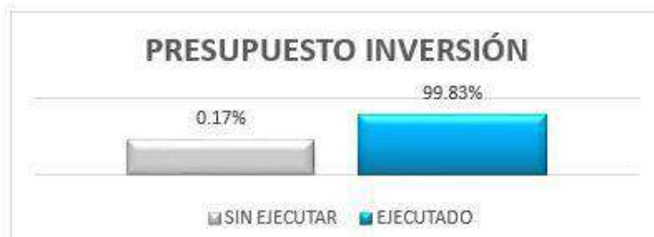
Gráfica No. 11