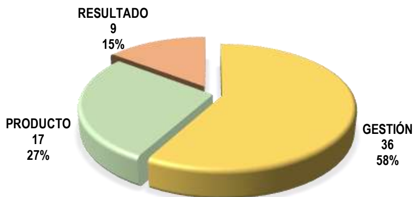
Gráfica No. 3 Cumplimiento por Tipo de Indicador