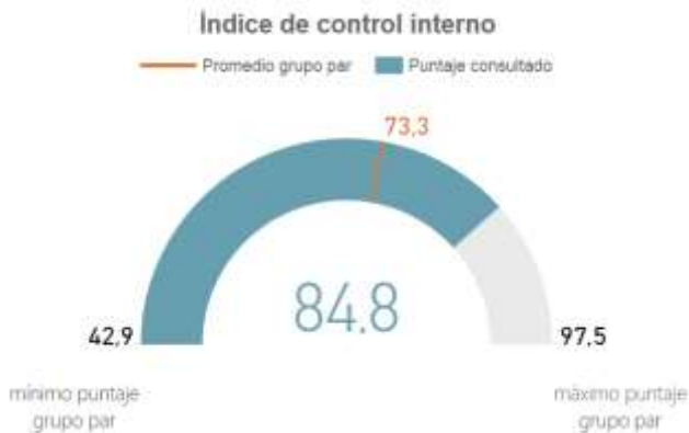
Grafica 9 – Resultados Desempeño Institucional MECI