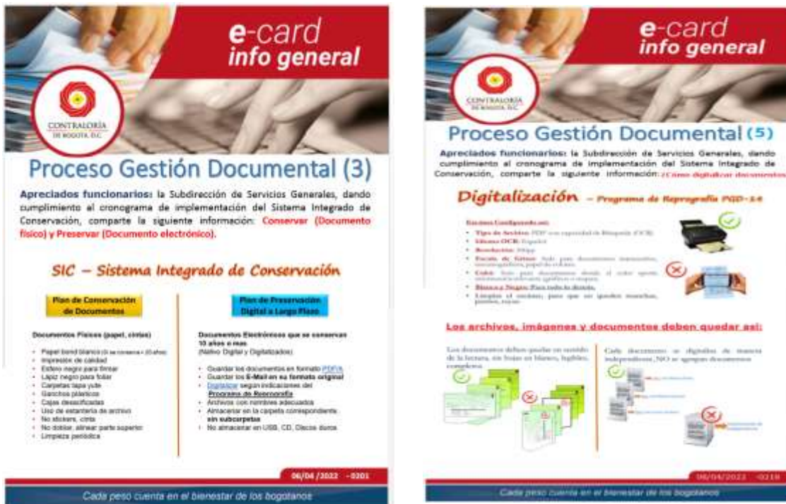
Grafica No 12