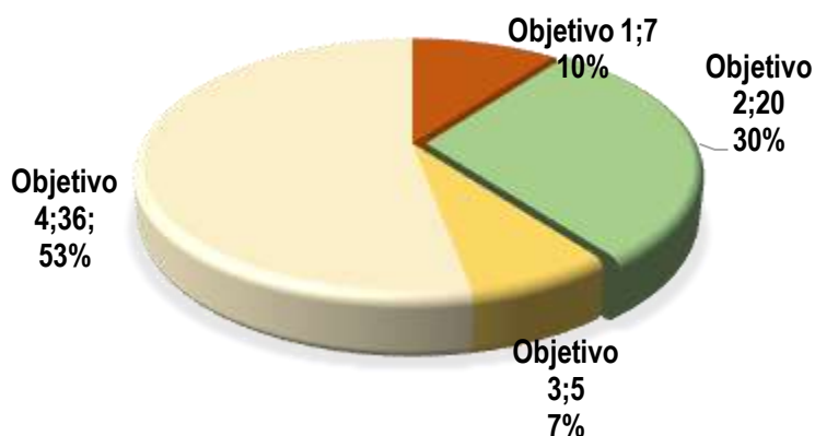
Gráfica No. 1 Distribución y participación de indicadores por objetivo