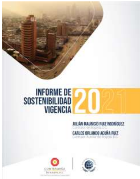
Grafica No 6 Caratula Informe de Sostenibilidad

Como estrategia adicional de información se mantuvo la ejecución de una campaña de sensibilización y capacitación a los delegados responsables de cada proceso, Dirección Sectorial y DRI. La Dirección de Planeación se encarga actualmente de lo relacionado con los temas del Pacto Global.