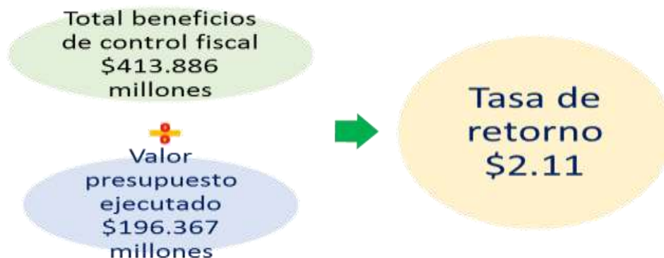
Gráfica No. 7